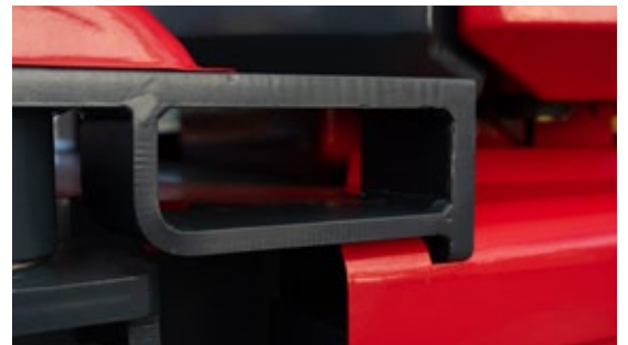
Ingebouwde gaten voor laadvorken